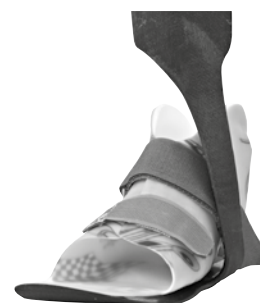
KiddieGAIT® med Surestep™