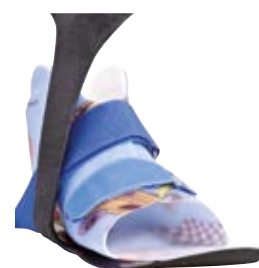
KiddieGAIT® med SMO

KiddieFLOW™, KiddieGAIT® og KiddieROCKER® skal i de fleste fall kombineras med en fothylsa som kan kontrollerer fotens position.