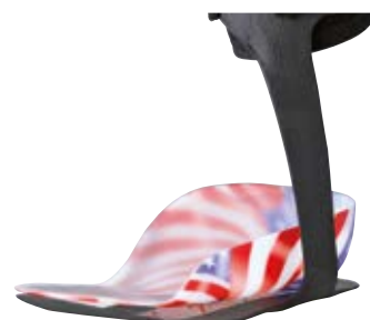
KiddieGAIT® med UCB