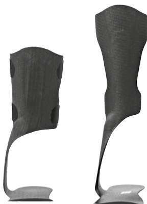
Babystørrelser Større størrelser

Sammenlignet med Flow giver KiddieGAIT® mere stabilitet i sagittal retning.